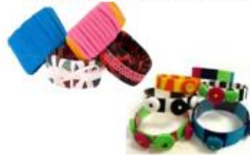
ΒΡΑΧΙΟΛΙΑ ΑΠΟ ΚΟΜΜΑΤΙΑ ΠΛΑΣΤΙΚΟΥ ΜΠΟΥΚΑΛΙΟΥ ΜΕ ΥΦΑΣΜΑΤΑ ΚΑΙ ΚΟΡΔΕΛΕΣ