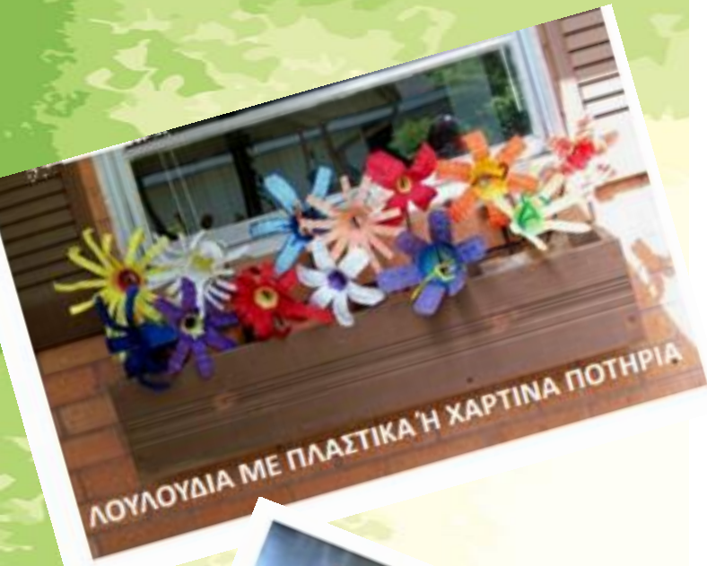
ΛΟΥΛΟΥΔΙΑ ΜΕ ΠΛΑΣΤΙΚΑ Ή ΧΑΡΤΙΝΑ ΠΟΤΗΡΙΑ