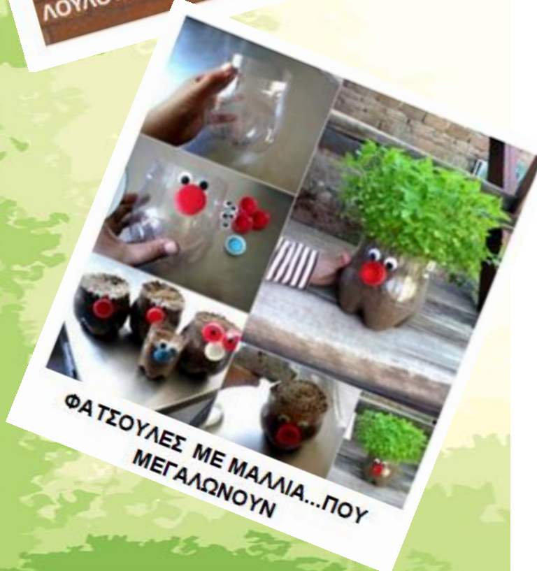
ΦΑΤΣΟΥΛΕΣ ΜΕ ΜΑΛΛΙΑ...ΠΟΥ ΜΕΓΑΛΩΝΟΥΝ