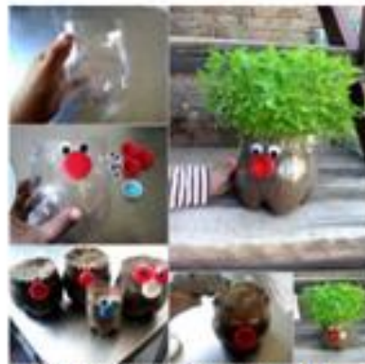
ΦΑΤΣΟΥΛΕΣ ΜΕ ΜΑΛΛΙΑ...ΠΟΥ ΜΕΓΑΛΩΝΟΥΝ