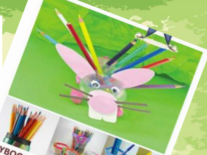
ΜΟΛΥΒΟΘΗΚΗ ΜΕ ΠΛΑΣΤΙΚΟ ΜΠΟΥΚΑΛΙ