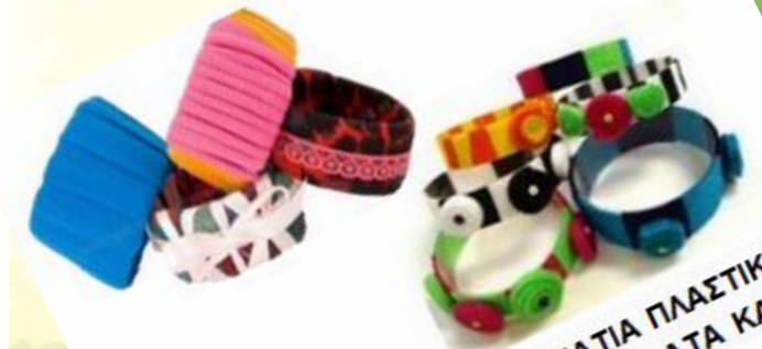
ΒΡΑΧΙΟΛΙΑ ΑΠΟ ΚΟΜΜΑΤΙΑ ΠΛΑΣΤΙΚΟΥ ΜΠΟΥΚΑΛΙΟΥ ΜΕ ΥΦΑΣΜΑΤΑ ΚΑΙ ΚΟΡΔΕΛΕΣ